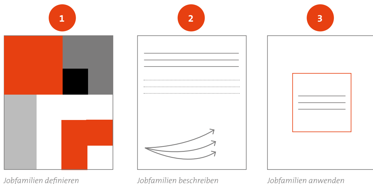
Abbildung 3: Jobfamilien bilden in drei Schritten

In unserem Beispiel möchte ein mittelständisches produzierendes Unternehmen, die Schlicht und Einfach GmbH, Jobfamilien einführen, um ein einfaches Kompetenzmanagement umzusetzen. Dies soll die Führungskräfte darin unterstützen, die Anforderungen und Kompetenzen in ihren Bereichen besser gegenüberstellen zu können und bei internen Nachbesetzungen den Blick für Mitarbeitende anderer Funktionsbereiche öffnen. Das Unternehmen kann dabei in einigen Unternehmensbereichen auf gut gepflegte Funktionendiagramme zurückgreifen (siehe Abbildung 4).