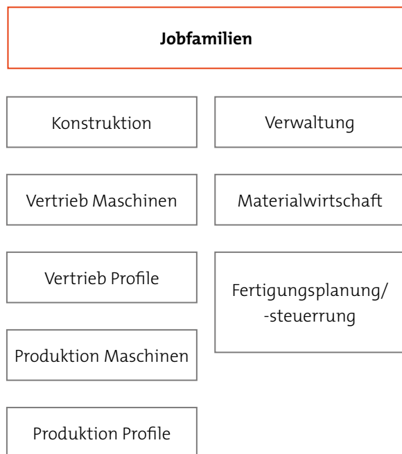
Abbildung 5: Jobfamilien bei der Schlicht und Einfach GmbH

Bei der Schlicht und Einfach GmbH werden in einem Workshop mit Personalverantwortlichen, Geschäftsführung und Abteilungsleitungen folgende Jobfamilien gebildet: Konstruktion, Vertrieb Maschinen, Vertrieb Profile, Produktion Maschinen, Produktion Profile, Verwaltung, Materialwirtschaft und Fertigungsplanung/-steuerung.